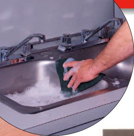
← Limpieza del fregadero de un restaurante con una fibra comercial.